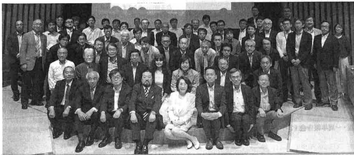
防災学術連携体の参加学会代表・防災連携委員と日本学術会議防災減災学術連携委員会委員 2018年6月5日第1回「防災に関する日本学術会議・学協会・府省庁連絡会」