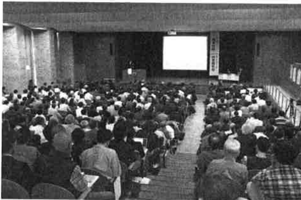
熊本地震・一周年報告会（30学会発表）熊本県庁大会議室