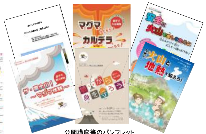
公開講座等のパンフレット