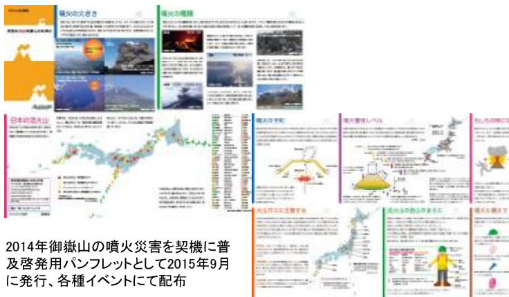
2014年御嶽山の噴火災害を契機に普及啓発用パンフレットとして2015年9月に発行、各種イベントにて配布