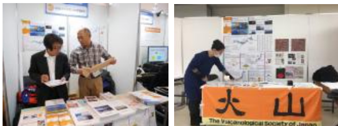
ぼうさいこくたい、ぎゅっと防災博等に出展