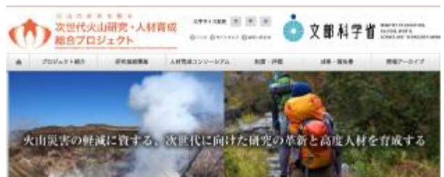
次世代火山研究育成プロジェクトに協力団体として参加