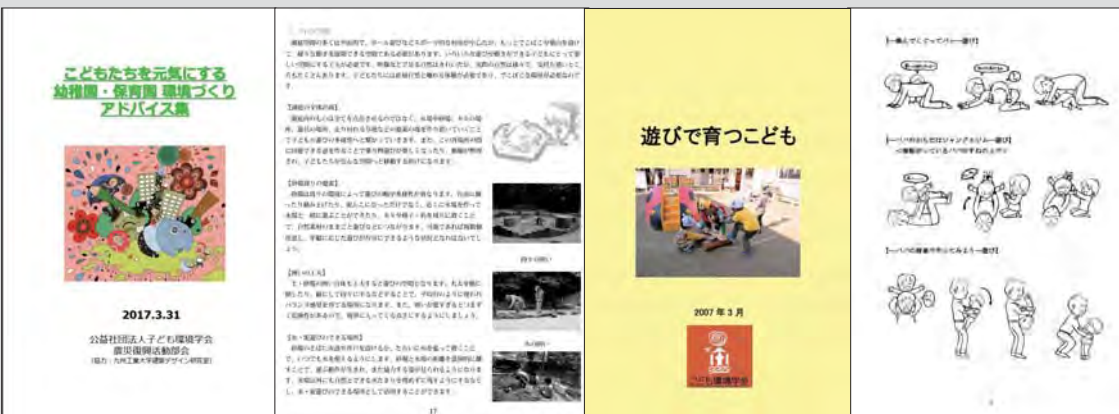
図3 保育環境におけるあそび環境活性化のためのアドバイスブック (左：A、右：B)