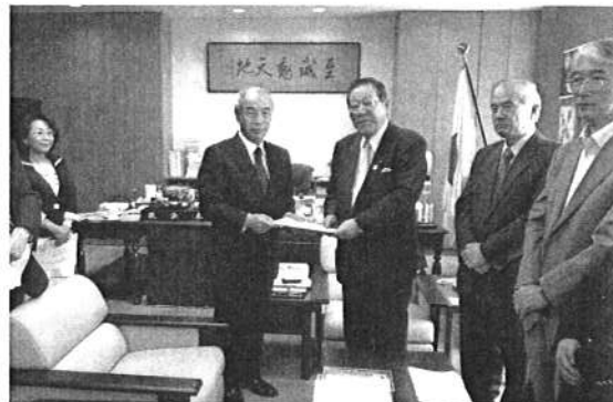
●奥村展三文部科学副大臣