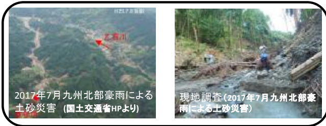
2017年7月九州北部豪雨による土砂災害

(構成会員) 産・官・学 大学、行政、民間 会員数:個人会員(約2100名),賛助会員(約200団体)