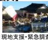
現地支援・緊急調査